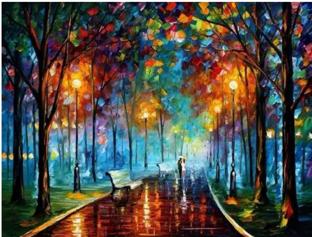
Noite Chuvosa de Leonid Afremov