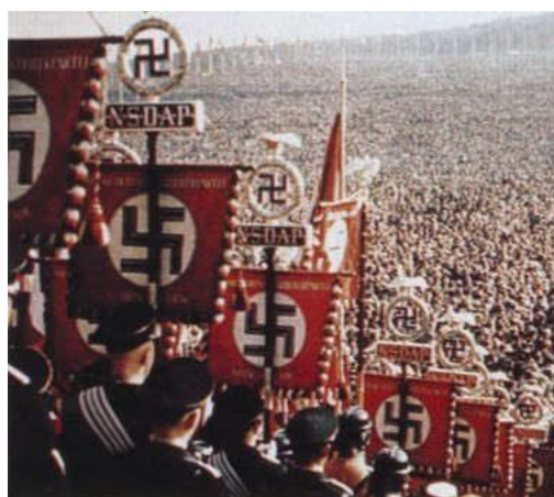
A suástica era o símbolo Nazista

Foi a ideologia criada e defendida pelo Partido Nacional Socialista dos Trabalhadores Alemães. O Partido Nazista foi fundado em 1920 por Anton Drexler. Adolf Hitler assumiu a liderança do partido em 1921, mantendo-se no posto até sua morte, ao final da Segunda Guerra Mundial.