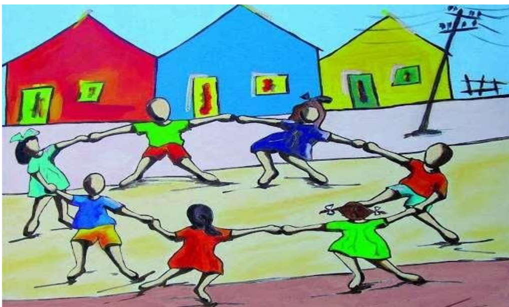
Obra " brincando de roda" de Ivan Cruz

D) Observe a seguinte obra de Arte: Faça uma releitura da obra " brincando de roda" de Ivan Cruz, representando as cores e alegria. Capriche!